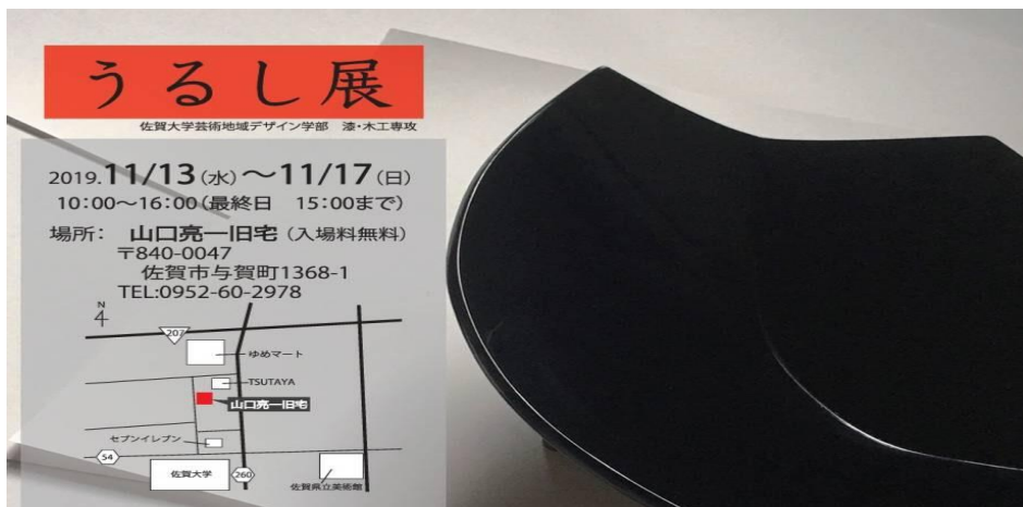
写真 うるし展の案内状