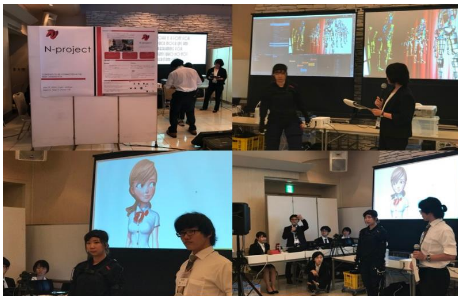
写真 研究開発と実践教育を行う拠点「redeco(リデコ)」