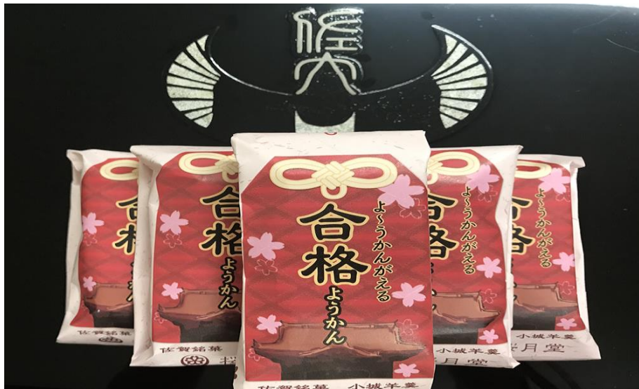
写真 よ〜うかんがえる 合格ようかん