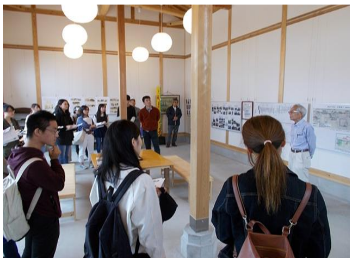
写真 コア科目_地元の方を講師とした勉強会