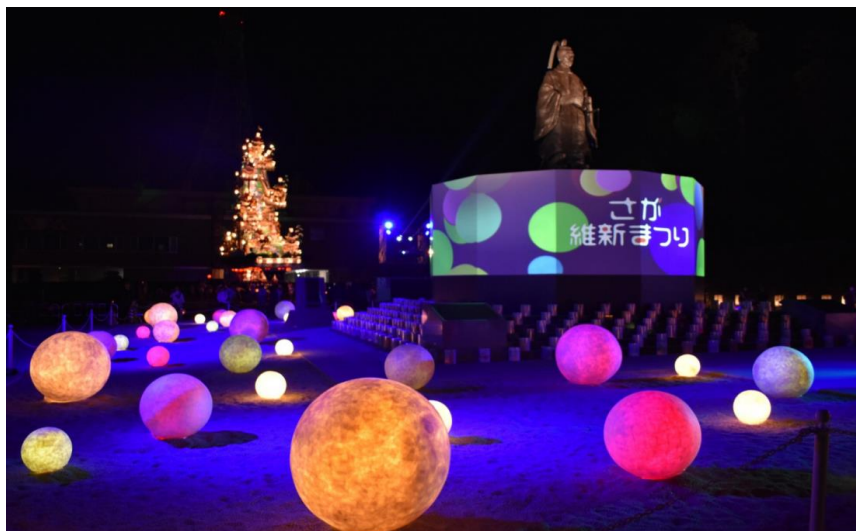
写真 空間演出「たまゆいのひかり～受け継ぎ芽吹く未来へ～」