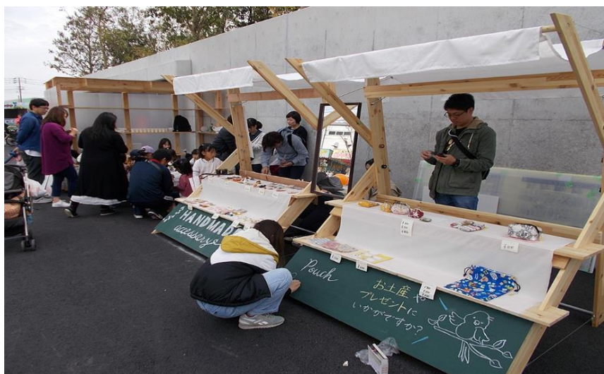
写真 佐賀県江北町との協働 マルシェの制作と活用